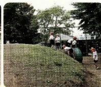
傾斜があると登りたくなる