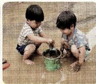
泥んこおもしろいねえ