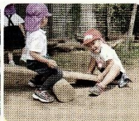
木の板を運んでシーソーに