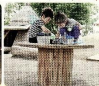
工事用のケーブルドラムでお家こっこ？