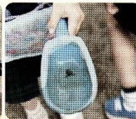
カエルの赤ちゃん見つけた！