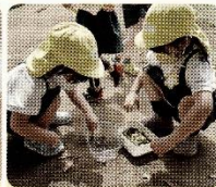
落ち穂を拾い集めて遊ぶ