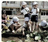
ピオトープではザリガニがよく釣れます