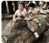
切り株で電車こっこ